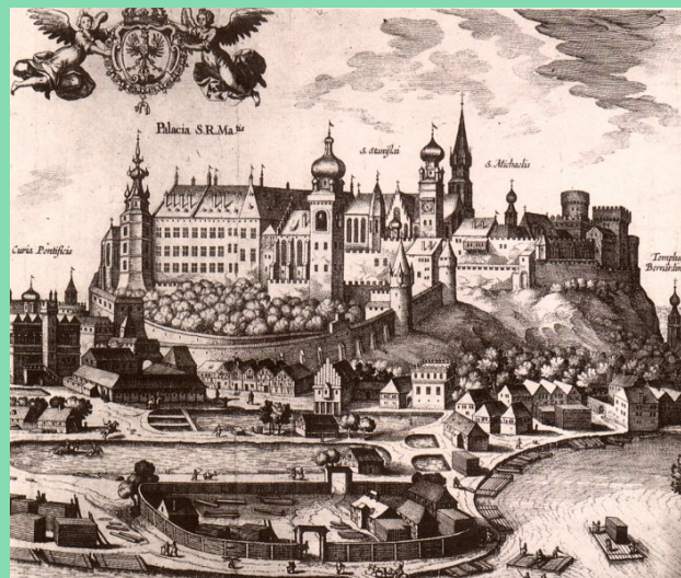
Wawel, "Civitates orbis terrarum", domena publiczna: https://pl.wikipedia.org/wiki/Wawel#/media/Plik:Wawel_end_16th_cent.jpg