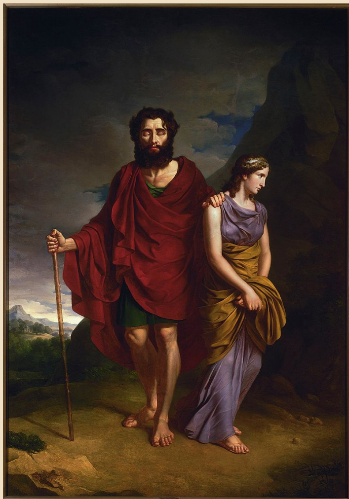
A. Brodowski, Edyp i Antygona, https://pl.wikipedia.org/wiki/Edyp_i_Antygona#/media/Plik:Antoni_Brodowski,_Edyp_i_Antygona_-_01.jpg , domena publiczna

Już się z tym pogodził, zaakceptował swój żywot i nie podejmuje dalszego buntu. Wydtubał sobie oczy i opuszcza miasto. Kolorystyka tego dzieła, a zwłaszcza ciemne chmury nad postaciami, wskazuje na klątwę, która wypełniła los mężczyzny, ale jest jeszcze los jego córki, który też jest naznaczony piętnem fatum.