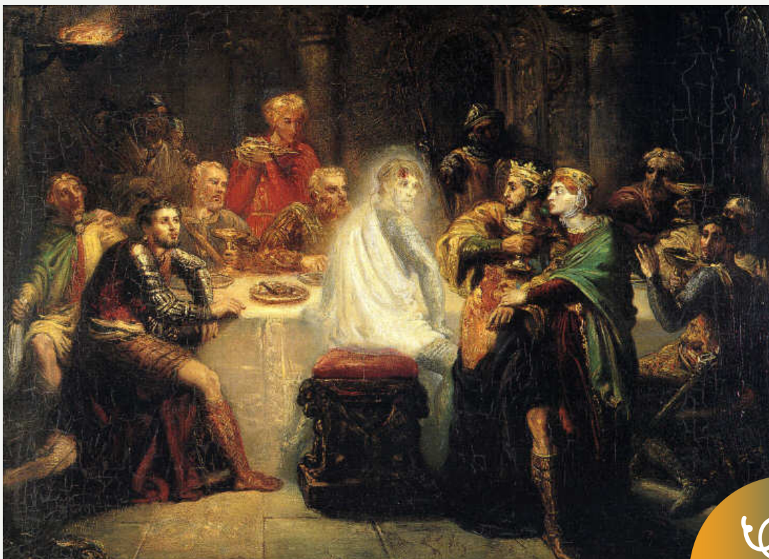
Duch Banquo, autor: Théodore Chassériau domena publiczna

Czemu służą przedstawienia zjaw, duchów i postaci fantastycznych? Omów zagadnienie, odwołując się do załączonego obrazu oraz wybranych utworów literackich.